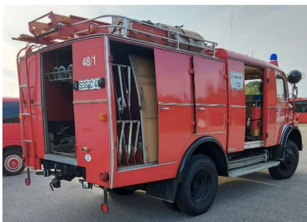
LF 8 Umbau

Wir haben die ruhige Zeit genutzt um unserem LF 8 einen neuen Glanz zu verleihen. Unsere beiden Gerätewarte Klaus und Maik haben die morschen Türen lackiert und auch die Gerätefächer überarbeitet. Danke an die beiden für die vielen eingesetzten Stunden.